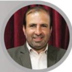
فتح الله حاجتی