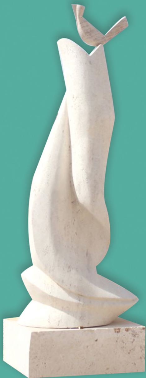
نخستین سمپوزیوم بین المللی مجسمه سازی شهرداری اهواز - فروردین ۱۳۹۷