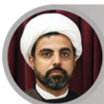
حجت الاسلام جاسم موسوی پور

رئیس کمیسیون فرهنگی و اجتماعی امور ورزش و جوانان