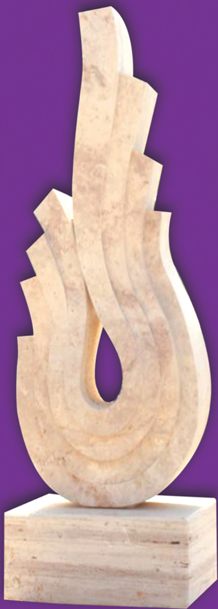
نخستین سمپوزیوم بین المللی مجسمه سازی شهرداری اهواز - فروردین ۱۳۹۷